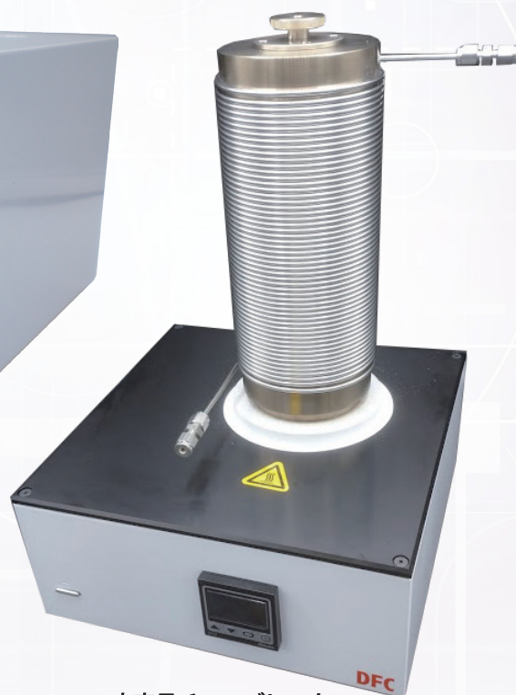
大容量チューブヒータ