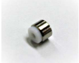
グリップフェラル(1/16") (10個入)