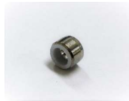
グリップフェラル(1/8") (10個入)