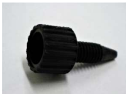
No.10-32UNF イージーフィットφ10(PEEK製) (10個入)