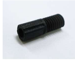
M6ヘッドナット(1/8") (10個入)