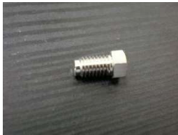
1/16"フィッティングS(SUS316製) (10個入)