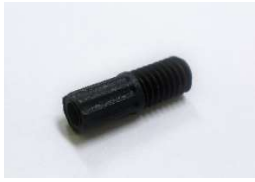
M6ヘッドナット(1/16") (10個入)