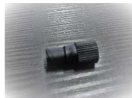
メスルアーアダプター(ETFE製)