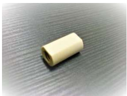
M6-M6 フラットシールユニオン(PEEK製)