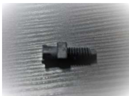
オスルアーアダプター(ETFE製)