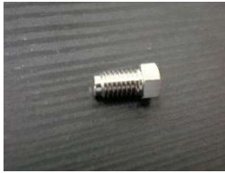
1/16"フィッティングS(SUS316製) (10個入り)