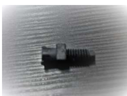
オスルアーアダプター ETFE製