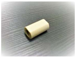
M6-M6 フラットシールユニオン PEEK製