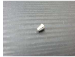
1/16"フェラル(SUS316製) (10個入り)