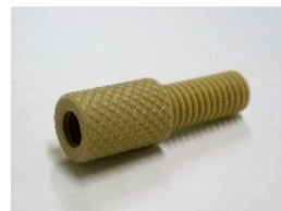
変換継手 (M6フラット-No.10-32UNFテーパーシール)